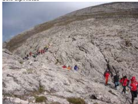
Momento de la prueba

Jarapalos). El sábado 25 de Abril tuvo lugar la tercera Travesía de Resistencia de este año ,valedera para la Copa Andaluza de Travesías de Resistencia , muy bien organizada por la Sociedad Excursionista de Málaga y la Federación Andaluza de Montañismo.